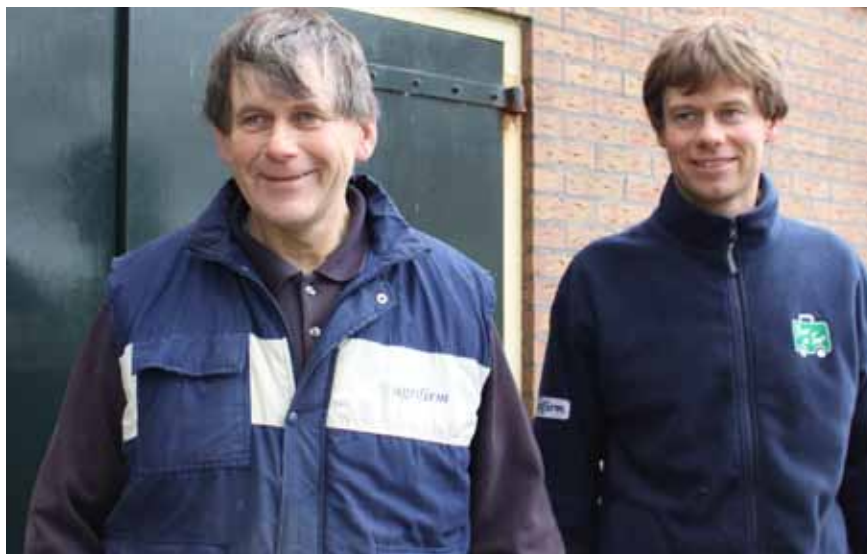
Sparer skatt: Far og sønn Zeeborg har investert i grønne gulv for å oppnå status som miljøgård. Grønne gulv med flapper kan redusere ammoniakkutslippene med opptil 50 prosent.